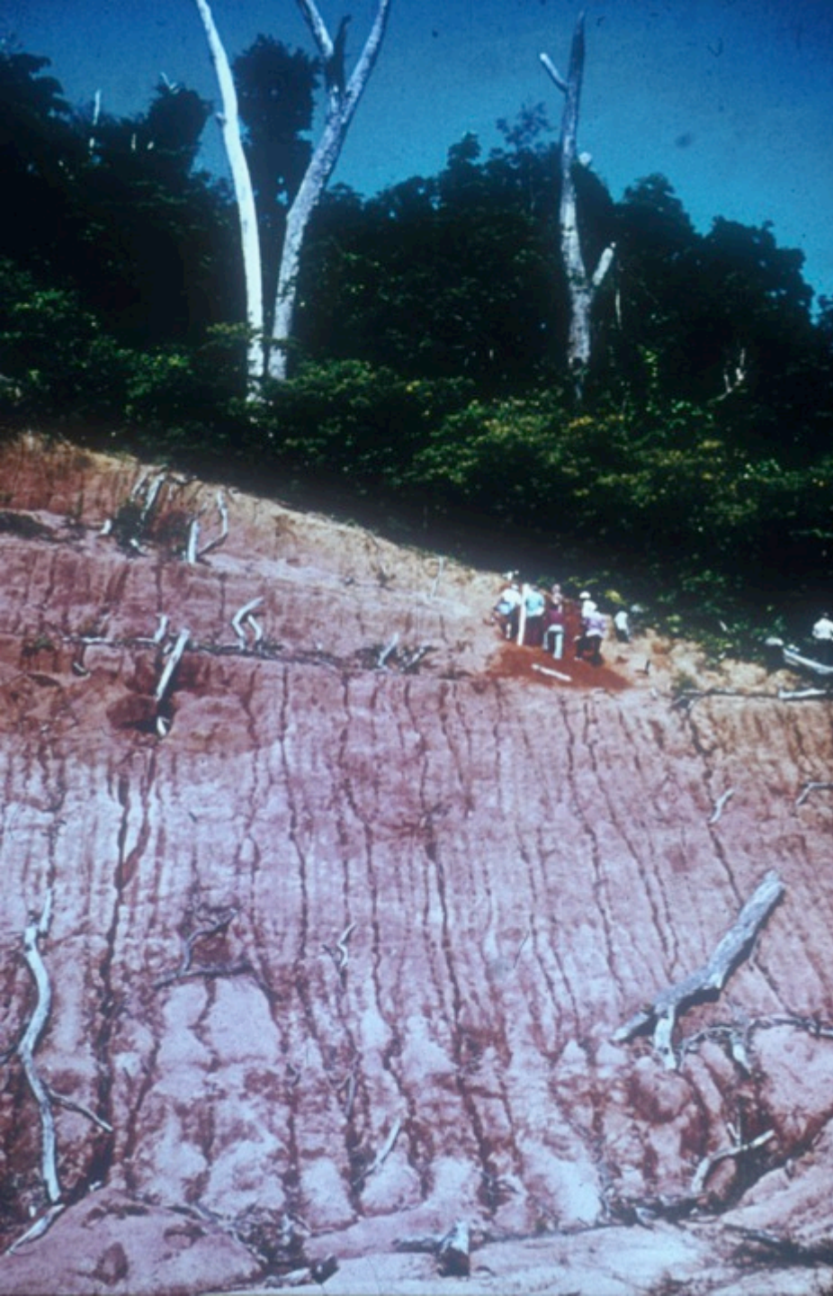
No. 61, Deep weathering down to 18 m in Orthic Ferralsol site