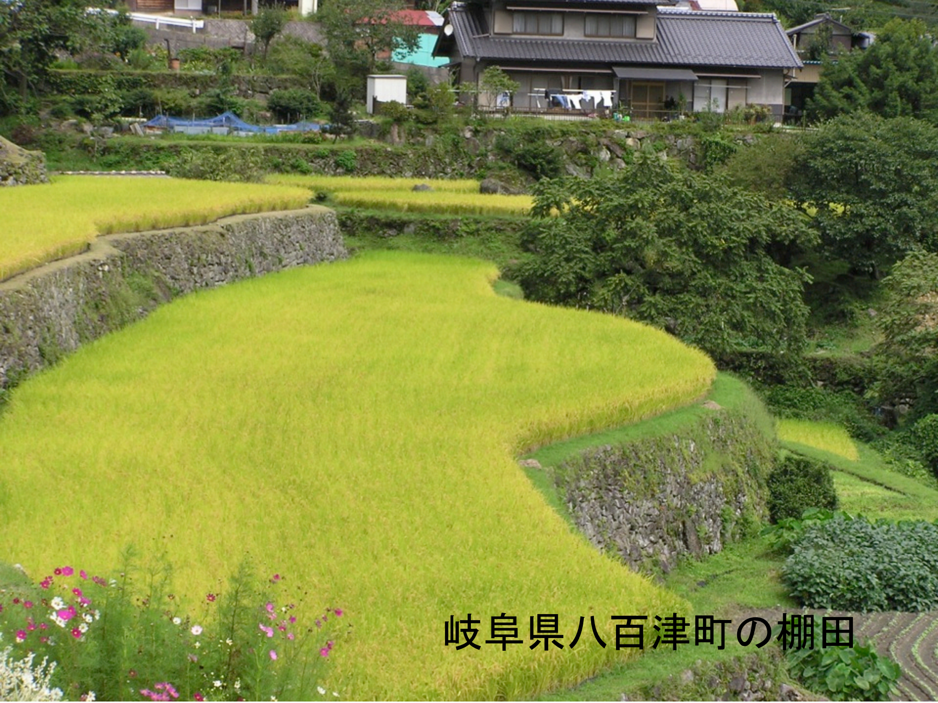
岐阜県八百津町の棚田