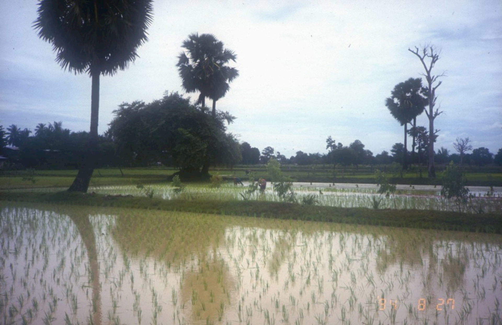
タイ国コンケン水田