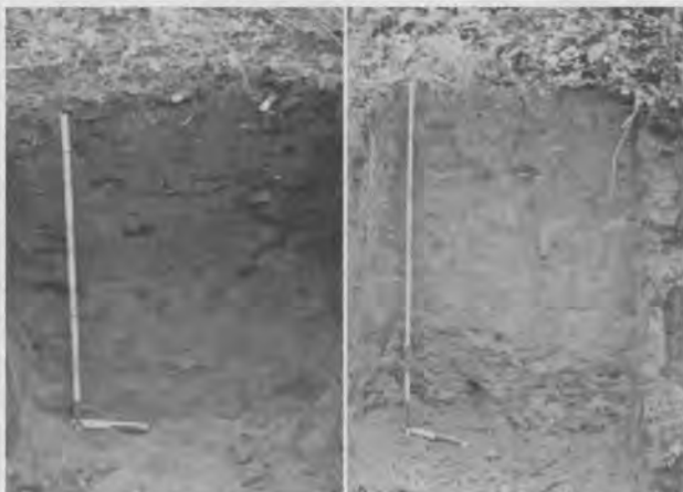
テラプレタ (左) とフェラルソル (右) の土壌断面の比較 B. Glaserら (2001) の論文より

テラプレタは紀元前800年頃から西暦1500年以降スペイン・ポルトガルをはじめとする西欧人によって征服されるまで使われていた。しかしボーリング調査によると土壌中の炭化物の量は紀元前9000年頃から飛躍的に増加していること、アマゾンにお