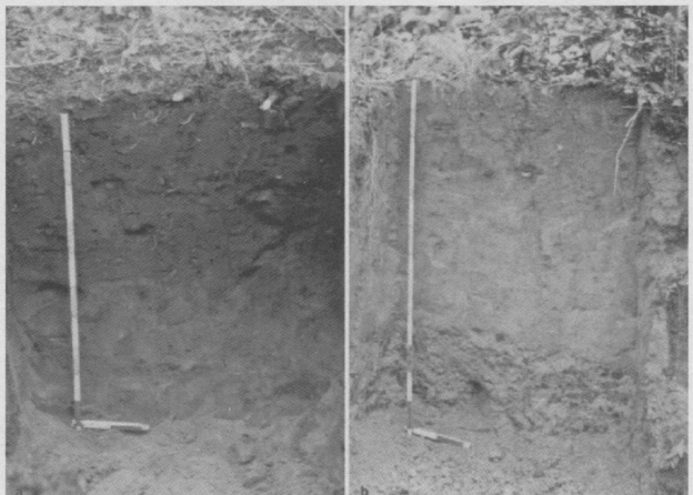
テラプレタ (左) とフェラルソル (右) の土壌断面の比較 B. Glaserら (2001) の論文より

テラプレタは紀元前800年頃から西暦1500年以降スペイン・ポルトガルをはじめとする西欧人によって征服されるまで使われていた。しかしボーリング調査によると土壌中の炭化物の量は紀元前9000年頃から飛躍的に増加していること、アマゾンにお